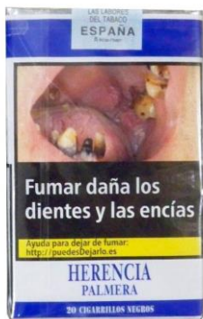
HERENCIA PALMERA 4,10