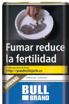
BULLBRAND 20 4,10