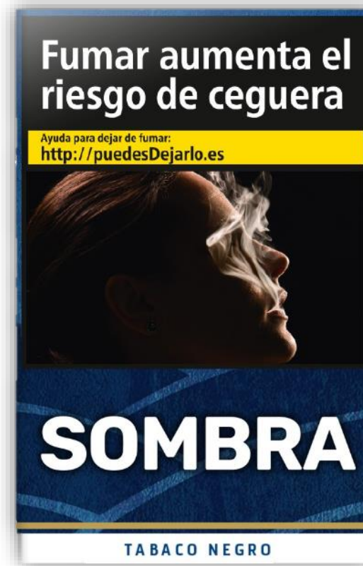
SOMBRA 20 4,00