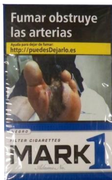
MARK1 20/LARGO 4,10