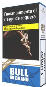
BULLBRAND 100'S 4,00